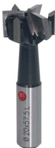
Art. 2.20.11 Maßstab 1:1 Full size

On request with short or shortened centerpoint. All other diameters can be produced on request.