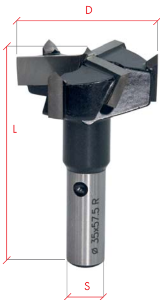
Art. 2.35.01 Maßstab 1:1 Full size

Shank with clamping flat and adjustment screw; 3 wings + 3 spurs