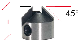
Artikel as5-01 Maßstab 1:1 Full size

For installation on dowel drills with back guide. Angel 45°.